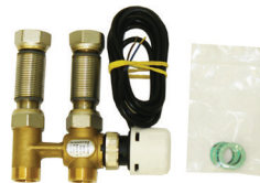
3-tieventtiili, tuotekoodi: VTX21PPS102